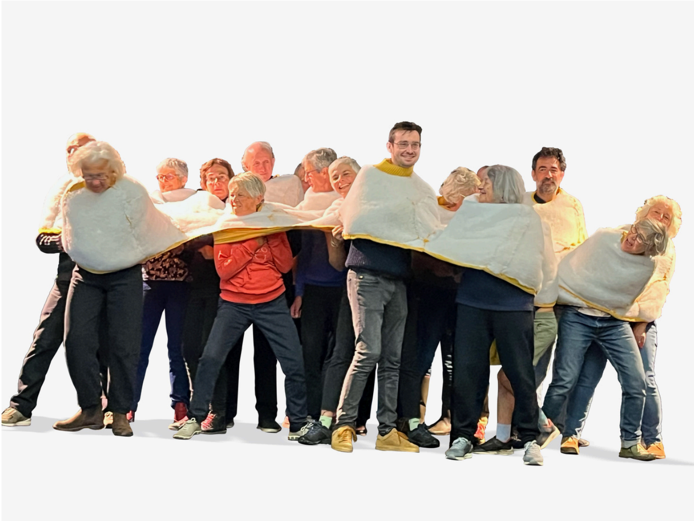
PEAU COMMUNE - Sculpture participative et immersive, mailles, coton, dimensions variables - 2024.

PEAU COMMUNE engage les corps dans une structure partagée. Soutien et contrainte s'y ajustent : chaque mouvement transforme l'ensemble. Le lien se fait..