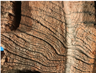
SÈVE - Péccot #2 - Projet in situ - Métal, bois d'arbre – deux modules 15 × 6 × 0,7 mètres - 2023