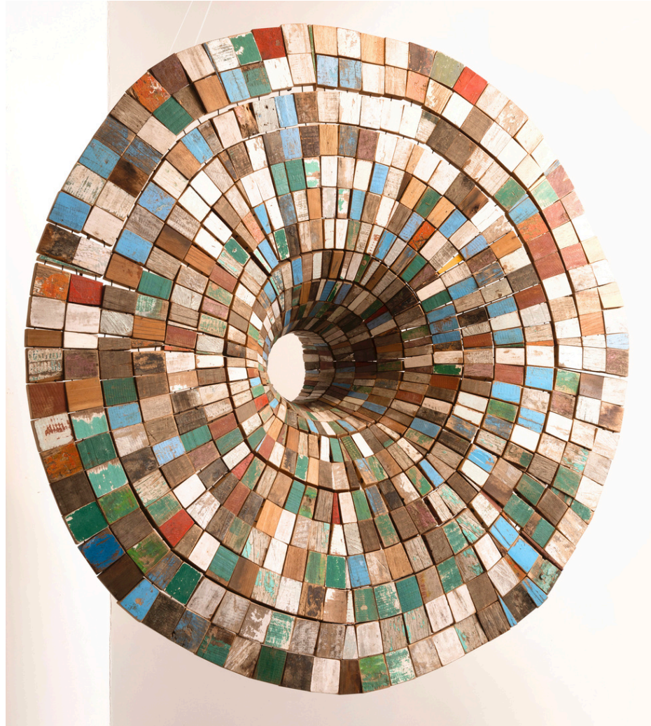
FRONTIÈRE - Fragments de bateaux, fil à thon, métal, Ø 140 cm × 50 cm - 2017

La forme se déploie et se referme. Elle engage le regard, qui circule et ajuste sa lecture. Une mémoire maritime affleure. La pièce fait aussi écho aux travaux de Stephen Hawking.