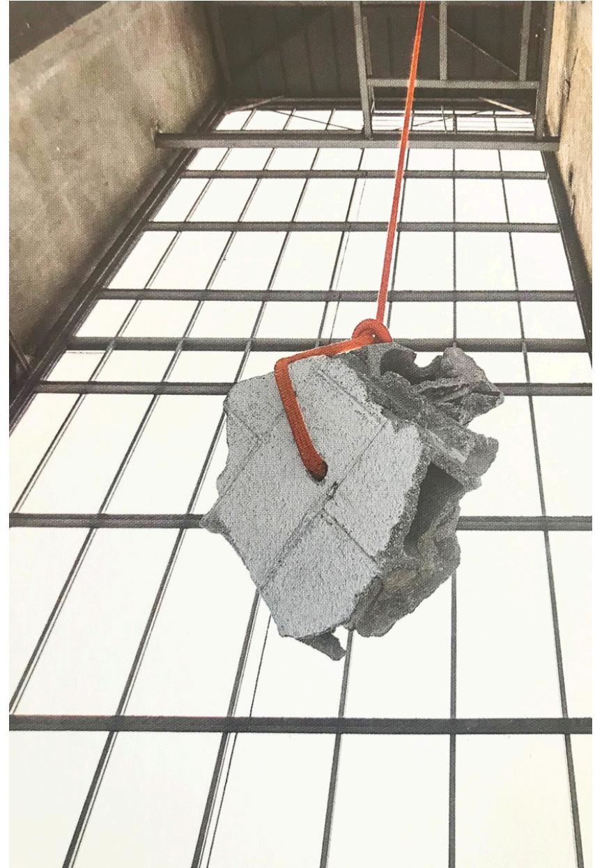
SEMENCE - Installation in situ, tri Postal Paris. Drisse, gravats, 30 x 40 x 150 M - 2021.