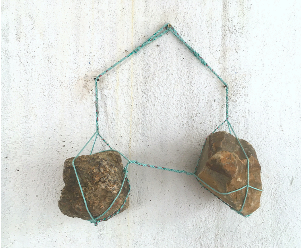
COURAGE - Silex, gneiss, cordage, 30 x 16 x 25 cm - 2013