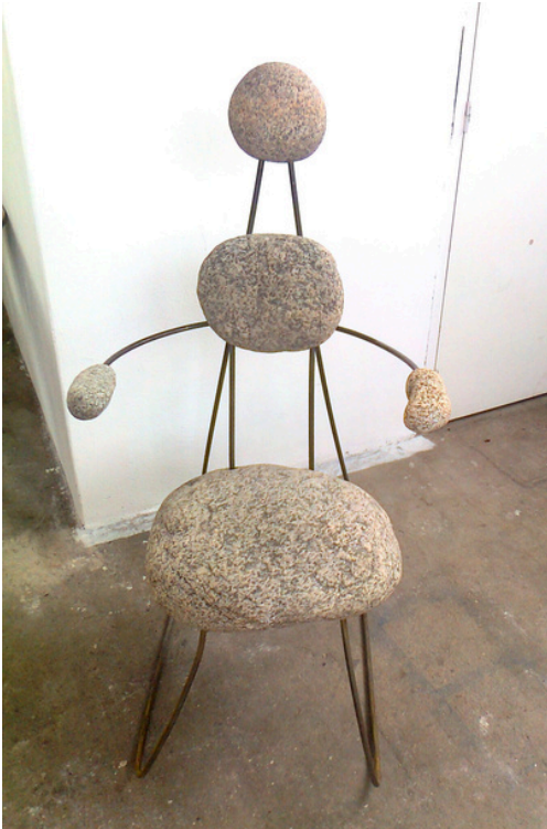
ETHNOERGO Granite, métal cintré à la main, 135 x 75 x 90 cm - 2010

Trois formes de pause. Trois seuils. Le repos un espace à l'écart.