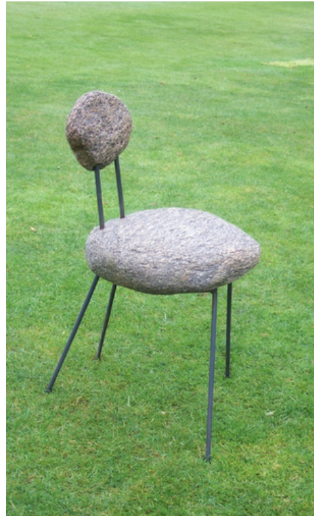
SILENCE Granite, métal 85 x 42 X 45 cm - 2010

La pause prend place, le corps s'y installe