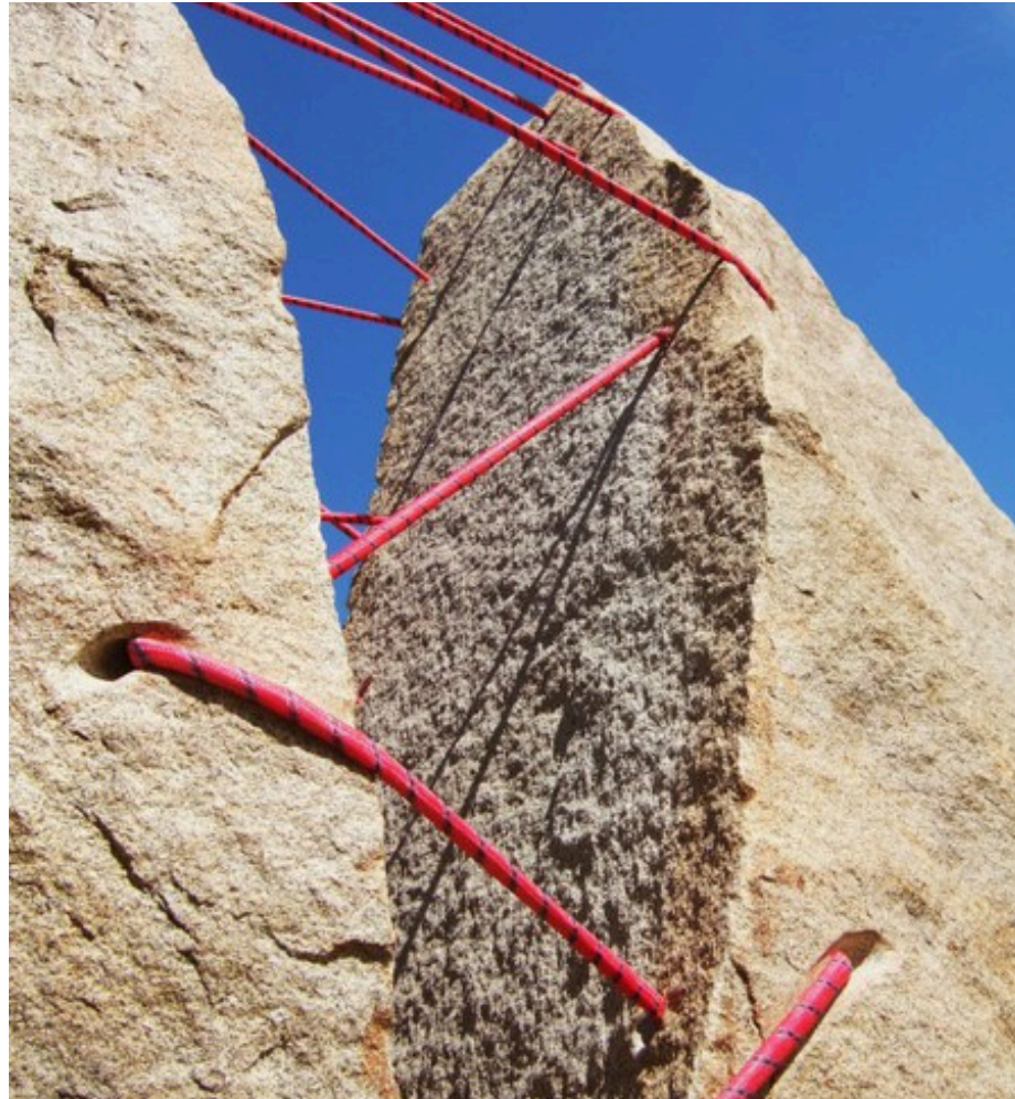
CÉCILE BONDUELLE Sculpteure/plasticienne