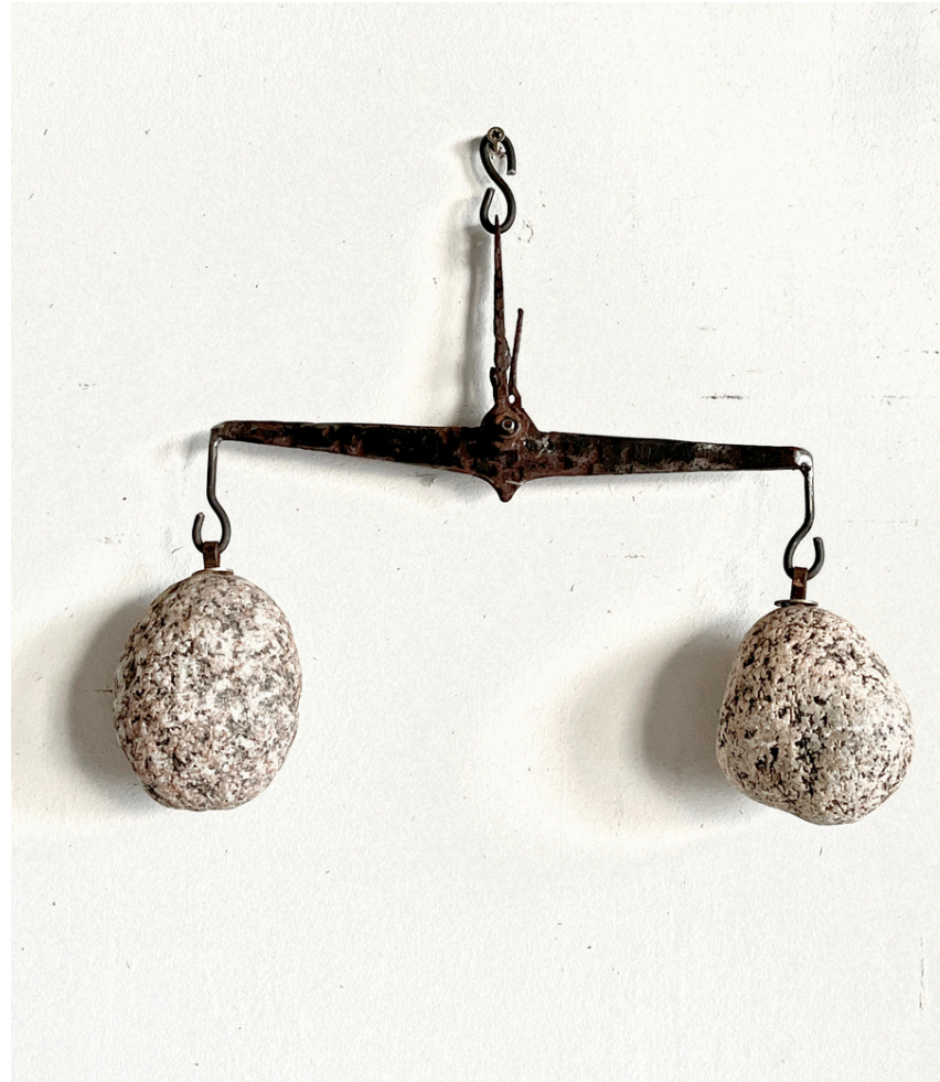
FOURBERIE - Granite, métal, 28 x 6 x 24 cm - 2013

Le jeu frappe, le réel pèse. Et parfois, il ruse.