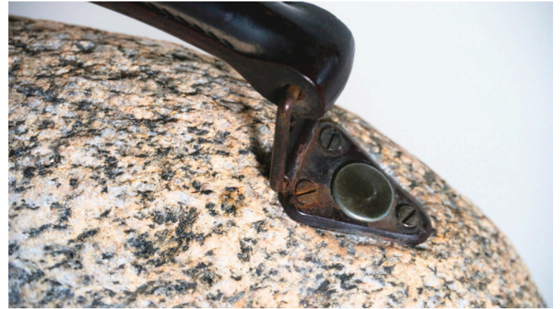
PETIT FARDEAU - Granite, bakélite, métal, 25 × 20 × 5 cm - 2013

Le lourd devient transportable. Le fardeau devient compagnon. On le pose.